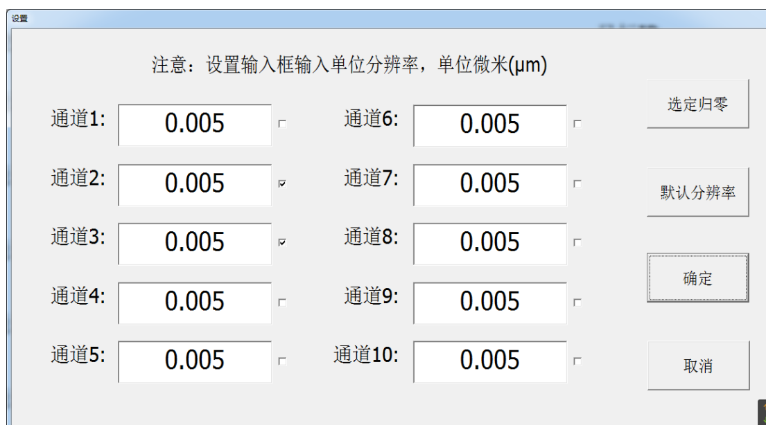
图 7-1 分辨率设置