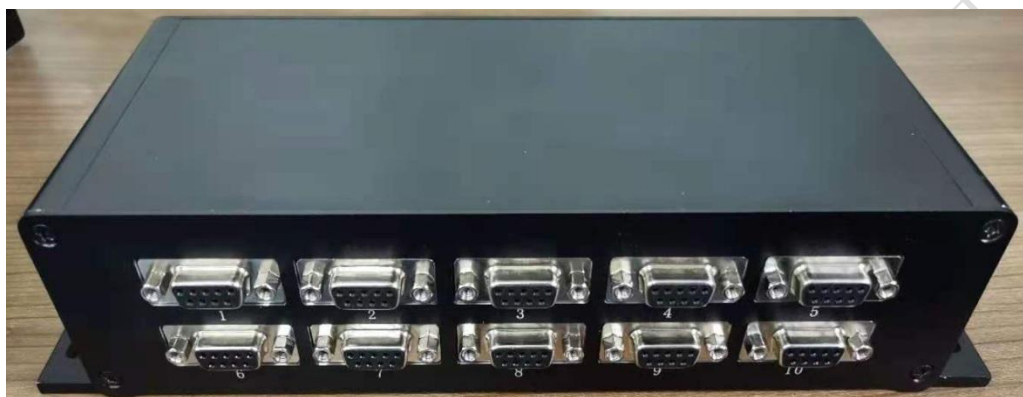
图 2-1 产品外观